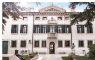
Fondazione Mons. Alessandro Marangoni Colognola ai Colli

Un cordiale grazie al Direttore e a tutti gli operatori che hanno reso possibile il raggiungimento di questo importante traguardo.