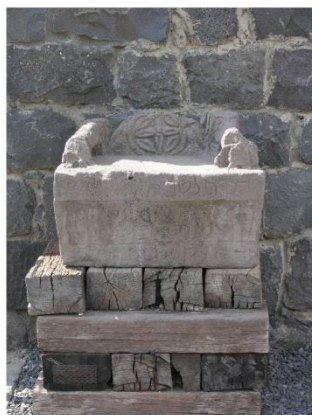
Corazin: cattedra della sinagoga

La comunità risponde con "Amen". Poi il custode prende dall'armadio il rotolo della Torah , la Legge mosaica , e lo porge all'incaricato di turno per la lettura. È proibito recitare a memoria, perché il testo non deve subi-