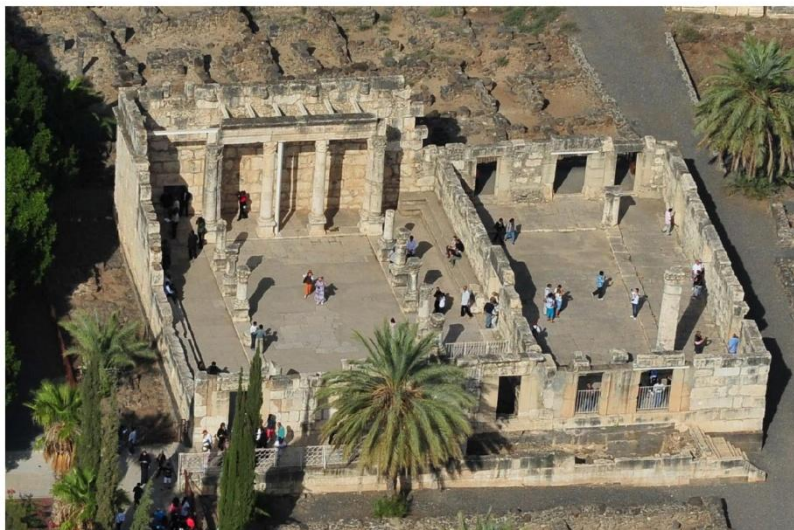
Cafarnao - Sinagoga "Bianca" IV secolo d.c.